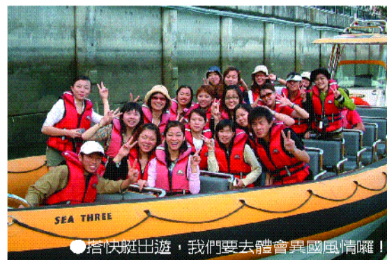
●搭快艇出遊，我們要去體會異國風情囉！

要感謝可愛的中臺，還有像小朋友的老師 Joni & James，有他們的帶領，這次的遊學倍增色彩。Thanks! (黃泰翔)