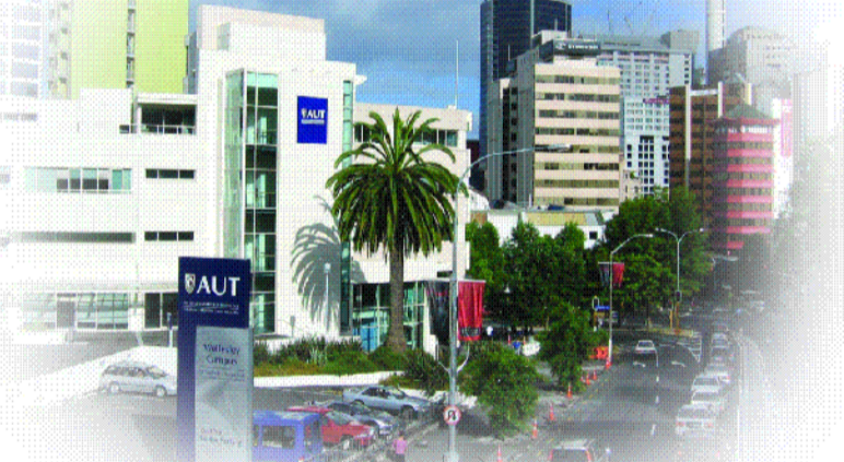
●紐西蘭奧克蘭科技大學校區。

學校的生活，跟台灣不同，小班制，注重閱讀和口語，剛開始有些不適應，每次開口說話時，都須在心裡打草稿，但這不是辦法！所以我開始勇敢表達心中想法，同時我很喜歡課堂氣氛，和老師的感覺像朋友，加上老師很關心學生在 homestay 的情形，上課也很輕鬆，讓我覺得在國外唸書是一種享受。課餘，和同學在奧克蘭的街道閒