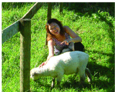
●農場上可愛的小綿羊。