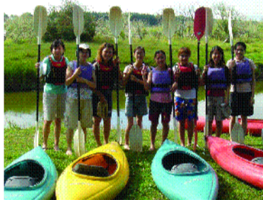
●泛舟是我們到紐西蘭的新體驗。