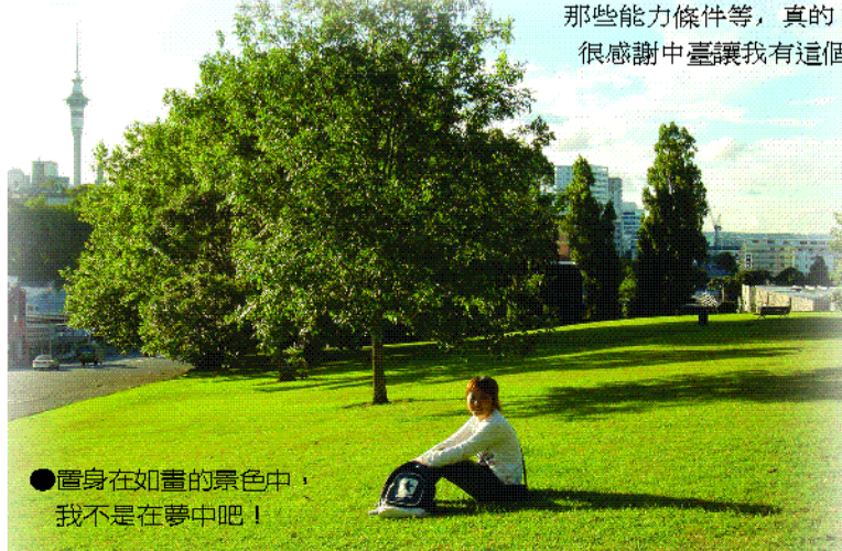
●置身在如畫的景色中，我不是在夢中吧！

3. 沒人幫忙時什麼都要靠自己，不用怕～就給他！勇敢的問下去，即使動作表情再怎樣遜！還是有人會懂的啦！