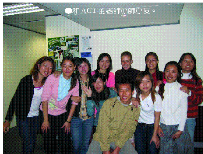
●和 AUT 的老師亦師亦友。